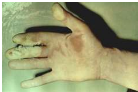
Рисунок 3 – Пузыри на ладонной поверхности пальцев правой кисти – влажная десквамация

Тяжелая (III) степень МЛП характеризуется развитием эрозивных поверхностей или язв, обнаруживаемых после спонтанного или хирургического удаления “покрышек” пузырей. Течение этой фазы - фазы эрозий и язв - различно для разных видов лучевого воздействия. При поражениях, вызванных мягким рентгеновским или бета-излучением низких энергий, эрозии заживают сравнительно быстро - через 1 - 2 недели от момента влажной десквамации, и их исходом бывает лишь легкая атрофия кожи. При МЛП, вызванных воздействием гамма - или нейтронного излучения, заживление язв затягивается на месяцы, если и происходит то, в основном, путем образования рубцов. Лучевые язвы или полностью не заживают, или, если заживление происходит – быстро рецидивируют. Если заживления язвы не происходит, а наблюдается прогрессирование (углубление процесса), то говорят о IV (крайне тяжелой) степени поражения (рисунок 4).