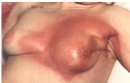
Рисунок 2 – Вторичная эритема в области левой половины грудной клетки совпадает с длительностью цикла клеточного обновления эпидермиса. Однако на практике время ее возникновения варьирует в гораздо более широких пределах, а именно от 3 - 5 дней до 3 - 4 недель. Кроме величины мощности поглощенной дозы и характера ее распределения по глубине кожи, время ее возникновения зависит так же от размеров площади поражения и от его локализации (С).

Вторичная или основная эритема (период разгара) (рисунок 2) по классическим представлениям должна возникать на второй- третьей неделе после облучения, что по времени