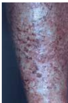
Рисунок 7 – Отдаленные последствия МЛП средней (II) степени тяжести голени от \gamma\beta -облучения.

Наличие телеангиоэктазий (рисунок 7) на атрофированной коже характерно для несколько более глубоких поражений; такие участки кожи легко травмируются или может иметь место самопроизвольное образование трещин и/или гиперкератозов и фиброза кожи. Длительно существующие гиперкератозы могут подвергаться малигнизации.