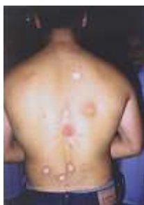
Рисунок 6 - Участки атрофии кожи спины после локального контакта с \gamma -источником

Наличие телеангиоэктазий (рисунок 7) на атрофированной коже характерно для несколько более глубоких поражений; такие участки кожи легко травмируются или может иметь место самопроизвольное образование трещин и/или гиперкератозов и фиброза кожи. Длительно существующие гиперкератозы могут подвергаться малигнизации.