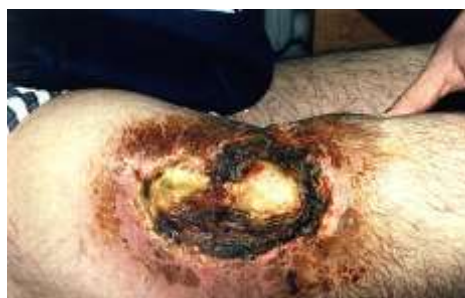
Рисунок 8 – Некротическая поздняя лучевая язва

Поздние лучевые язвы, обусловлены глубокими трофическими нарушениями, с развитием грубой соединительной ткани и вторичным поражением сосудистых структур, относятся к наиболее тяжелым отдаленным последствиям МЛП (рисунок 8).