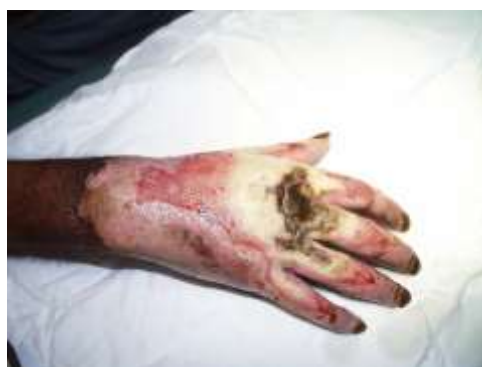
Рисунок 4 - Первичный некроз на тыльной поверхности правой кисти

Тяжелая (III) степень МЛП характеризуется развитием эрозивных поверхностей или язв, обнаруживаемых после спонтанного или хирургического удаления “покрышек” пузырей. Течение этой фазы - фазы эрозий и язв - различно для разных видов лучевого воздействия. При поражениях, вызванных мягким рентгеновским или бета-излучением низких энергий, эрозии заживают сравнительно быстро - через 1 - 2 недели от момента влажной десквамации, и их исходом бывает лишь легкая атрофия кожи. При МЛП, вызванных воздействием гамма - или нейтронного излучения, заживление язв затягивается на месяцы, если и происходит то, в основном, путем образования рубцов. Лучевые язвы или полностью не заживают, или, если заживление происходит – быстро рецидивируют. Если заживления язвы не происходит, а наблюдается прогрессирование (углубление процесса), то говорят о IV (крайне тяжелой) степени поражения (рисунок 4).