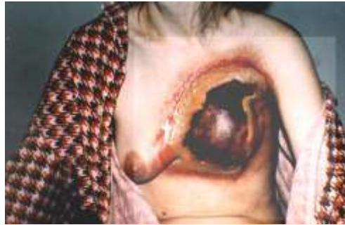
Рисунок 5 – Первичный некроз левой молочной железы

синюшного оттенка гиперемии с дальнейшим почернением тканей и формированием первичного некроза развивается тяжелейший, не поддающийся терапии болевой синдром. В таких ситуациях диагноз МЛП IV степени тяжести может быть поставлен уже в первые 3 - 5 дней (рисунок 5).