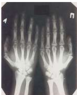
Рисунок 11 – Рентгенограмма кистей рук больного, перенесшего МЛП III степени тяжести, через 1 год после облучения. Признаки остеопороза в области эпифизов конечных фаланг