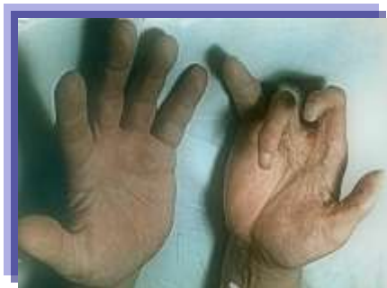
Рисунок 10 – Контрактуры суставов правой кисти больного, перенесшего МЛП III степени

При действии глубоко проникающих видов ионизирующего излучения в периоде последствий развиваются тяжелые поражения подлежащих тканей: деформации и контрактуры суставов (рисунок 10), дистрофия мышц, остеопороз (рисунок 11), остеомиелит, а иногда и остеонекроз, наряду с поздними лучевыми язвами.