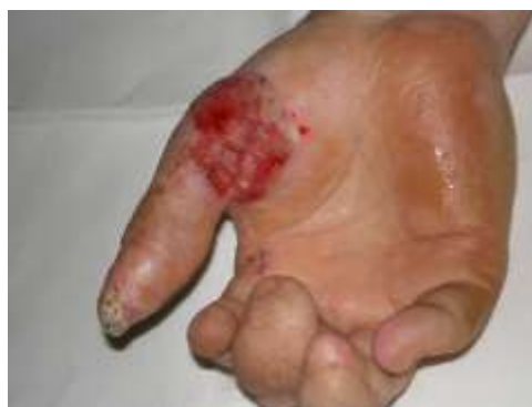
Рисунок 9 – Высоккодифференцированный плоскоклеточный рак, развившийся в длительно существующей поздней лучевой язве

Развитие опухолей кожи в области отдаленных последствий МЛП возможно при лучевом воздействии и в дозах, меньше пороговых для развития МЛП. Латентный период длится, как правило, от 5 до 60 лет, в среднем – 20-30 лет. Экспериментальные данные свидетельствуют, что наиболее часто после однократного или повторного рентгеновского облучения развивается базальноклеточный рак, реже - плоскоклеточный рак и фибросаркома. Частота развития базалиом зависит и от степени пигментации кожи: у европейцев они диагностируются значительно чаще, чем у представителей негроидной расы.